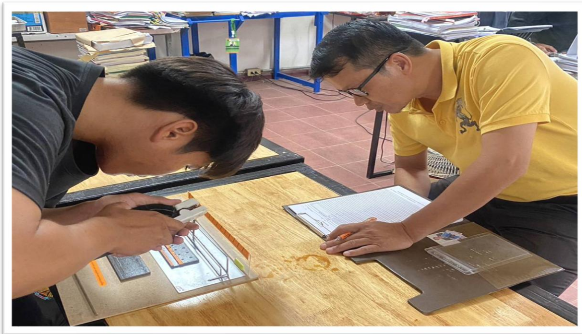
รูปที่ 3 นักเรียนฝึกฝนชุดฝึกทักษะระยะอาร์ก มุมนำและมุมข้างของการเดินแนวเชื่อม