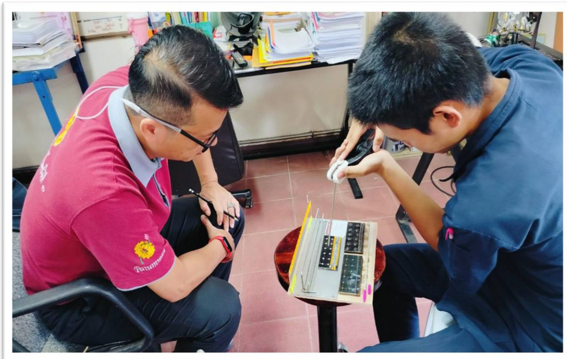
รูปที่ 1. นักเรียนฝึกฝนชุดฝึกทักษะระยะอาร์ก มุมนำและมุมข้างของการเดินแนวเชื่อม