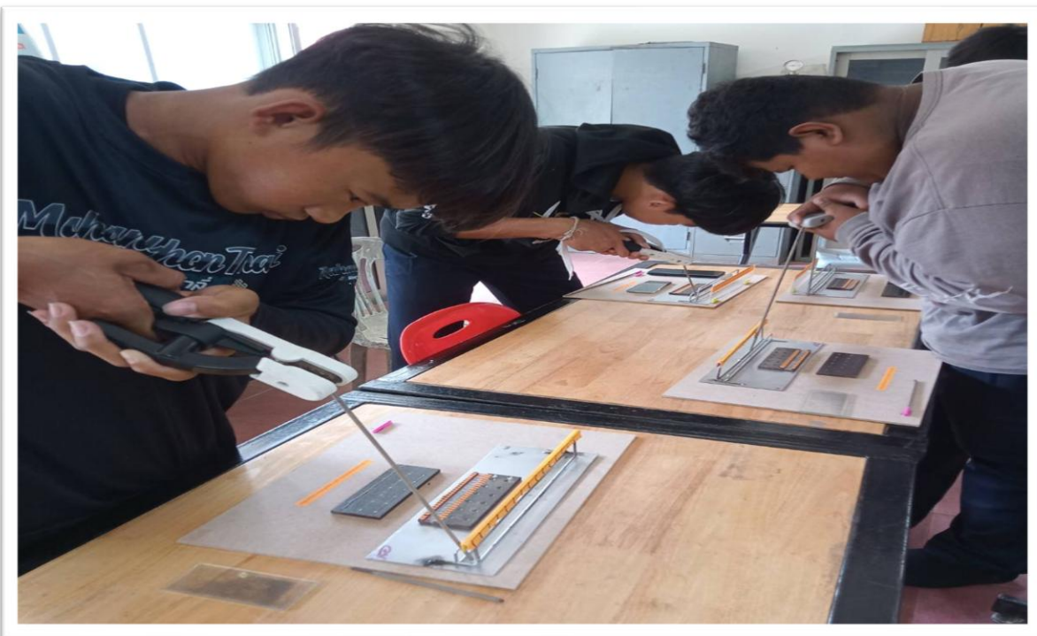
รูปที่ 4. นักเรียนฝึกฝนชุดฝึกทักษะระยะอาร์ก มุมนำและมุมข้างของการเดินแนวเชื่อม