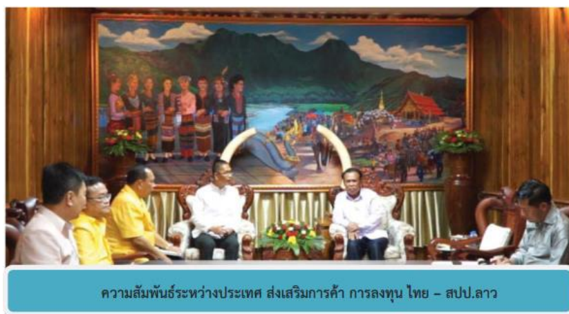
ความสัมพันธ์ระหว่างประเทศ ส่งเสริมการค้า การลงทุน ไทย - สปป.ลาว

ปี 2563 มีมูลค่าการค้ารวม จำนวน 17,170.17 ล้านบาท แยกเป็นมูลค่าการนำเข้า 13,171.23 ล้านบาท และมูลค่าส่งออก 3,998.94 ล้านบาท และดุลการค้า -9,172.29 ล้านบาท โดยมีอัตราการขยายตัวด้านการนำเข้าเพิ่มขึ้น คิดเป็นร้อยละ 68.74 ส่งออกลดลง คิดเป็นร้อยละ 90.42