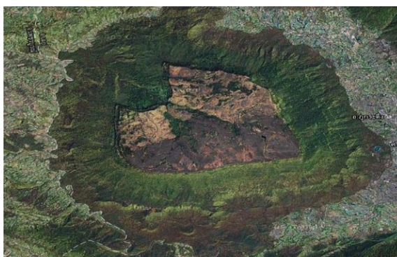
ภาพถ่ายดาวเทียม อุทยานแห่งชาติภูกระดึง อ่างเก็บน้ำภูกระดึง จังหวัดเลย