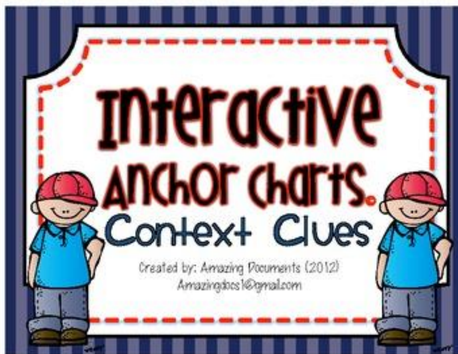
รูปภาพที่ 5: Interactive Anchor Chart

Source: Teachers pay Teachers - 350 x 270 คัดด้วยภาพ