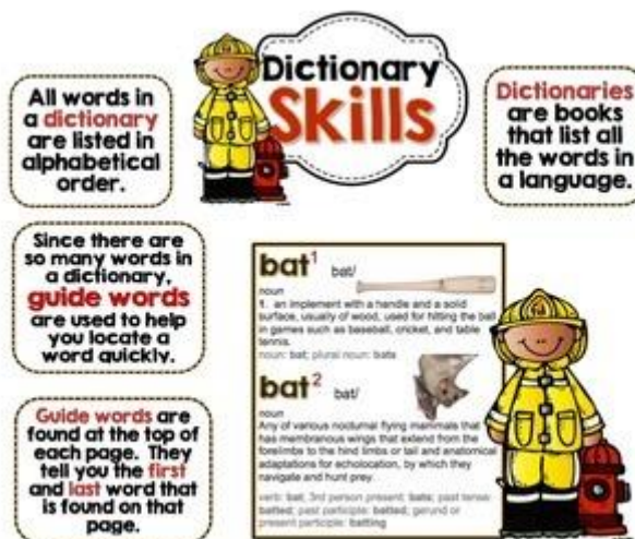
รูปภาพที่ 4: Words With Multiple Meaning

Source: Cambridge University Press - 419 x 527 คัดด้วยภาพ